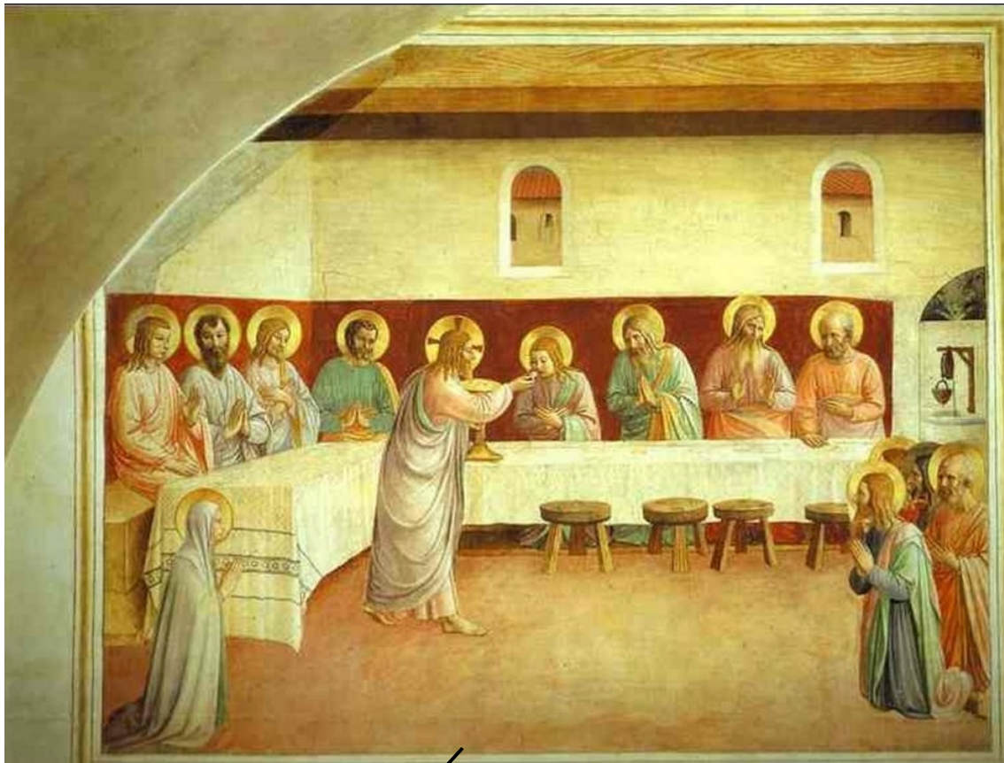
Beato Angelico – L'istituzione dell'Eucarestia (1450 ca) – Museo S. Marco - Firenze